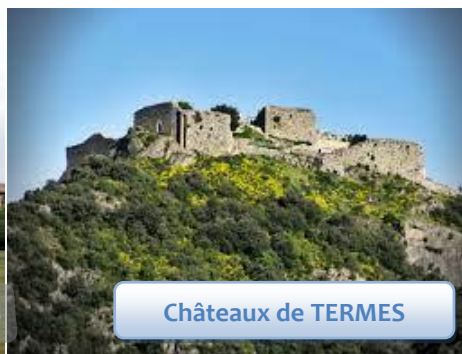
Châteaux de TERMES