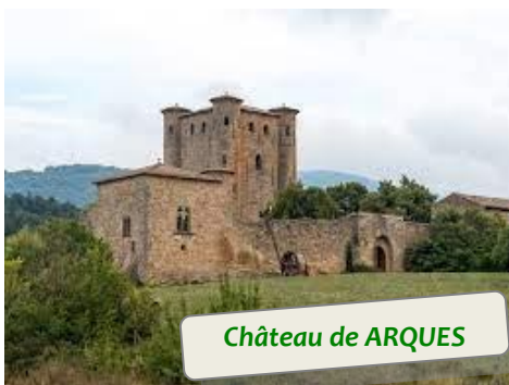
Château de ARQUES

C'est par des routes peu fréquentées par la circulation automobile que vous approcherez les hauts lieux de l'histoire du pays cathare et ses villages typiques